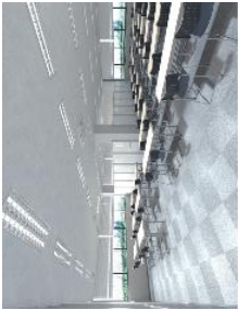
イベントスペース